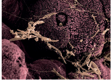
▲ Elektronenmikroskopische Detailaufnahme aus dem Dünndarm einer Maus mit verschiedenen Bakterienspezies des Mikrobioms.

„Wenn die Stuhltransplantation ein Vorschlaghammer ist, ist unsere Mikrobiom-Engineering-Technologie ein Meißel: kraftvoll, aber dennoch fein genug, um präzise zu wirken“, vergleicht Osbelt-Block die Werkzeuge. Weltweit testen Forschungsgruppen, unter anderem am HZI, ergänzende Werkzeuge, um das Mikrobiom mit einem „Skalpell“ zu manipulieren. So wollen sie Mikrobiom-Veränderungen möglichst ohne Nebenwirkungen erzielen. Dafür erforschen sie, wie sie mithilfe programmierbarer Antibiotika oder der Genschere CRISPR einzelne Gene von Bakterien direkt im Darm an- oder ausschalten können. Weitere Projekte widmen sich Bakteriophagen, die ebenfalls direkt im Darm wirken. Diese Viren können spezifisch